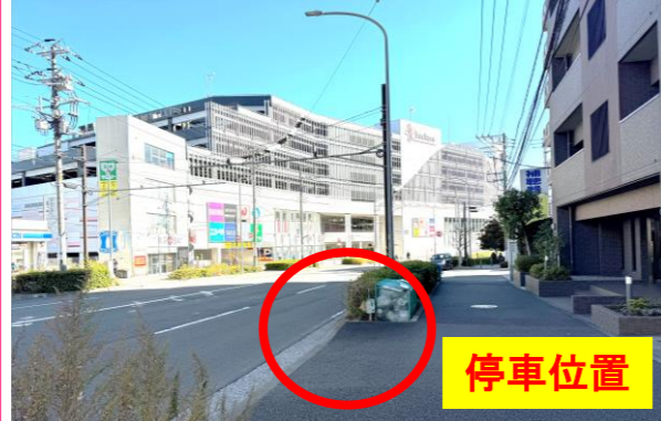
②サンヴェール戸塚