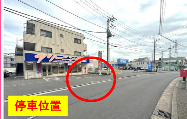
③ハックドラッグ・ クリーニング屋さん前