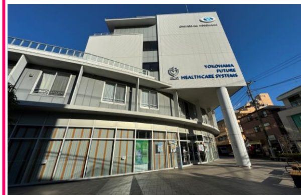
⑮OEN FOR ALL横浜 地域交流センター (戸塚共立レディースクリニック・戸塚共立透析クリニック)