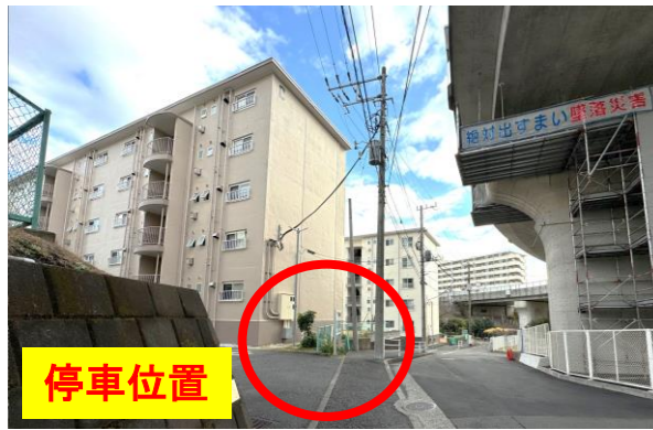
⑪東芝戸塚台コーポC棟前