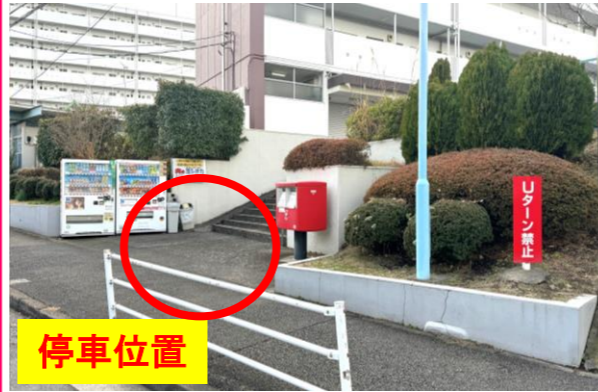
⑧ぐみさわ東ハイツ集会所