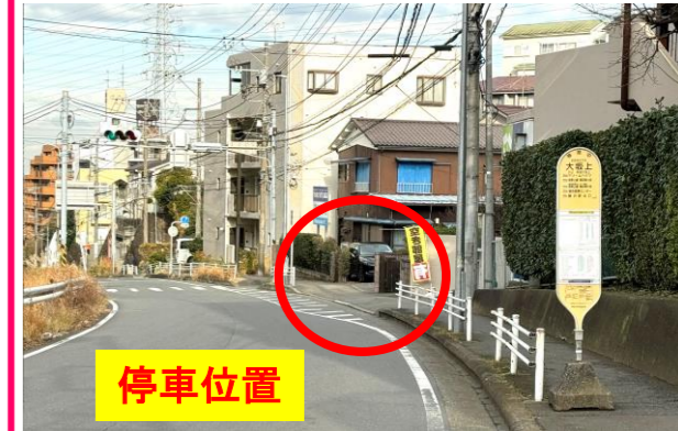
⑩大坂上バス停付近