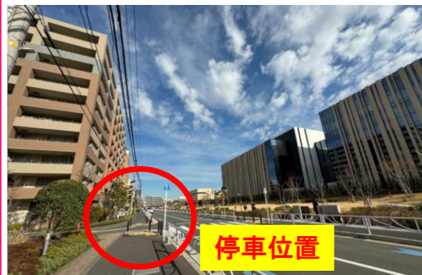
⑭フェアプレイス横浜戸塚