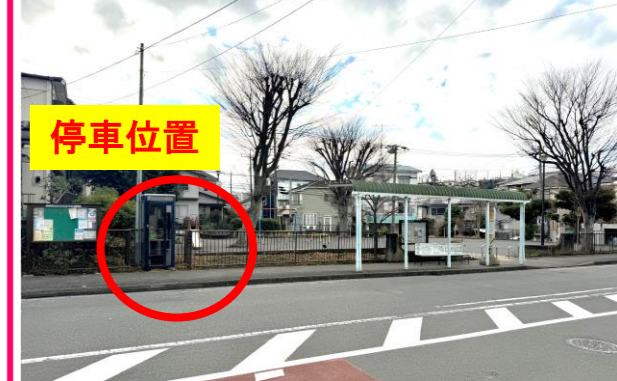
⑤汲沢団地バス停付近 (汲沢第2公園)