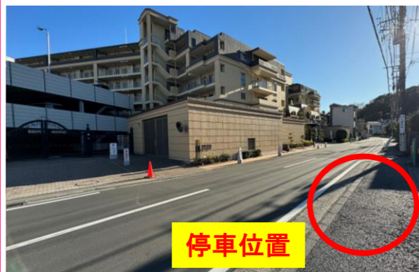
⑬グランシティ・パレ・ド・ リヴァージュ向かい